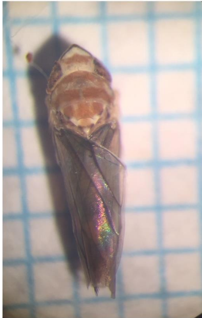
Slika 1. Odrasli oblik američkog cvrčka

U nastavku se nalazi slika odraslog oblika američkog cvrčka (Slika 1) te kartografski prikaz demarkiranih područja u Istarskoj županiji («Narodne novine», broj 55/18) (Slika 2).