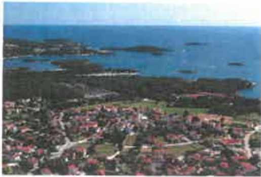
Funtana iz zraka

Objavljeno: 15. prosinca 2021. u kategoriji – Novosti