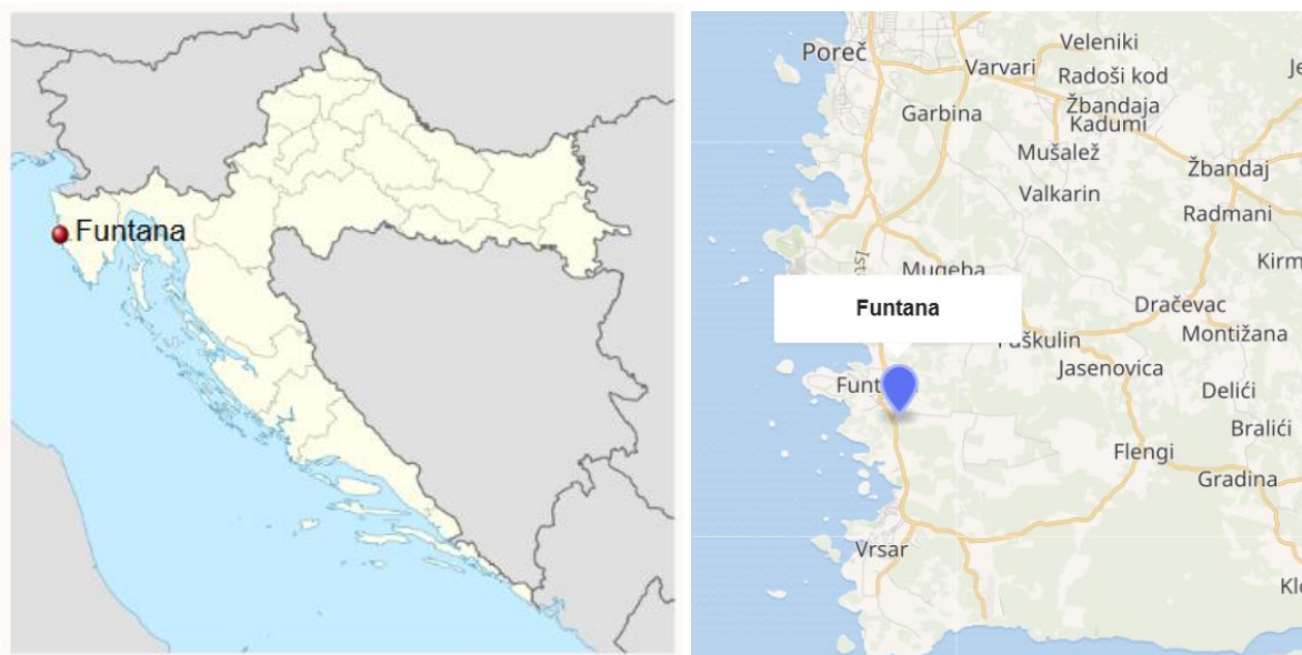
Slika 1. Zemljopisni položaj Općine

Općina Funtana-Fontane smještena je na zapadnoj obali Istre, u blizini poznatih turističkih centara poput Poreča i Vrsara. Kao jedna od mlađih i dinamičnih općina u regiji, Funtana-Fontane je prepoznatljiva po bogatoj kulturnoj baštini, prirodnim ljepotama i razvijenoj turističkoj ponudi temeljenoj na održivom turizmu. Povoljna lokacija uz Jadransko more i blizina važnih prometnih pravaca omogućuju jednostavan pristup te potiču gospodarski razvoj i kvalitetu života njezinih stanovnika. Funtana-Fontane je ribarsko, poljoprivredno i turističko mjesto na zapadnoj obali Istre, čije se priobalje proteže od Zelene Lagune na zapadu do Valkanele na jugu. Riječ je o najrazvedenijoj obali istarskog poluotoka s brojnim uvalama i otočićima.