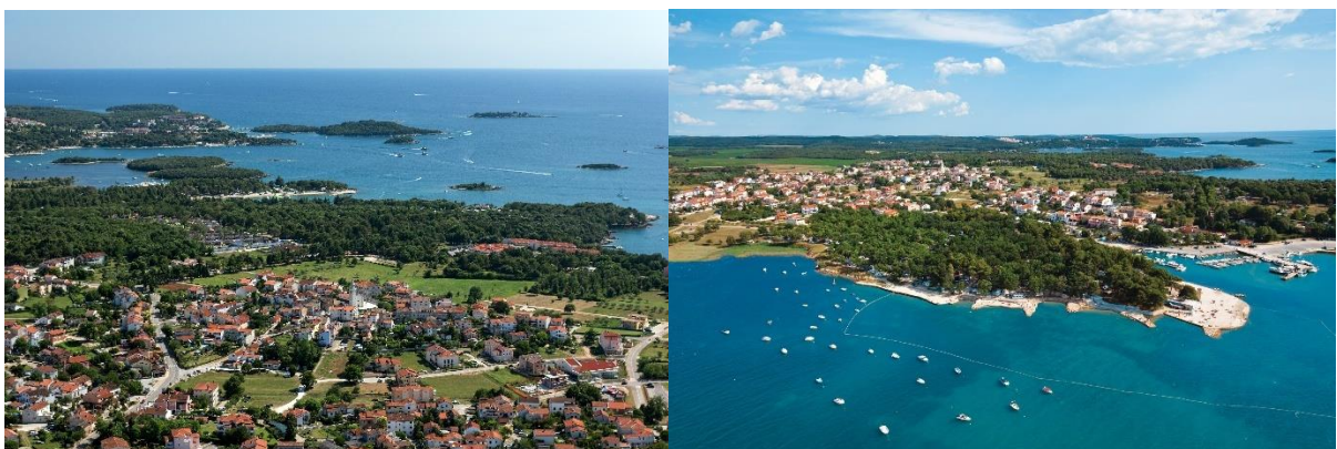
Slika 3. Funtana - Fontane

Općina Funtana-Fontane predstavlja vitalnu i aktivnu lokalnu zajednicu smještenu na zapadnoj obali Istre. Kao mala, ali dinamična sredina, Funtana-Fontane njeguje osjećaj pripadnosti i zajedništva među svojim stanovnicima, koji su temelj razvoja i napretka općine. Lokalna zajednica obilježena je tradicijom, bogatim kulturnim nasljeđem i snažnim vezama među građanima, što se reflektira kroz brojne inicijative i projekte usmjerene na unaprjeđenje kvalitete života. Općina Funtana-Fontane ustrojena je 2006. godine, izdvajanjem iz općine Vrsar.